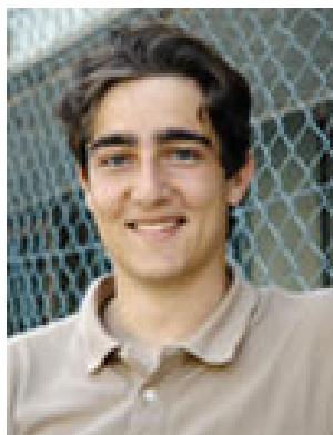
Kommentar von Ralf Imstpepf, JCVPO

Die Oberwalliser Jungsozialisten erheben in mit ihrem aktuellsten Vorstoss die Forderung den hochqualifizierten Wallisern, welche nach dem Studium ins Wallis zurückkehren, ihre zinslose Darlehen in nicht zurückzahlende Stipendien umzuwandeln. Dieser finanzielle Anreiz kann aber nur funktionieren, wenn während dem Studium nur noch zinslose Darlehen ausbezahlt werden. Weiter müssten auch alle Jugendlichen, welche sich weiterbilden, einen Anspruch auf zinslose Darlehen haben. Die JUSOO bestätigt mit ihrem Vorstoss - vermutlich unbewusst - die logische Forderung der JCVPO, das Stipendienwesen