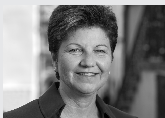
Viola Amherd, Nationalrätin und Stadtpräsidentin Brig-Glis